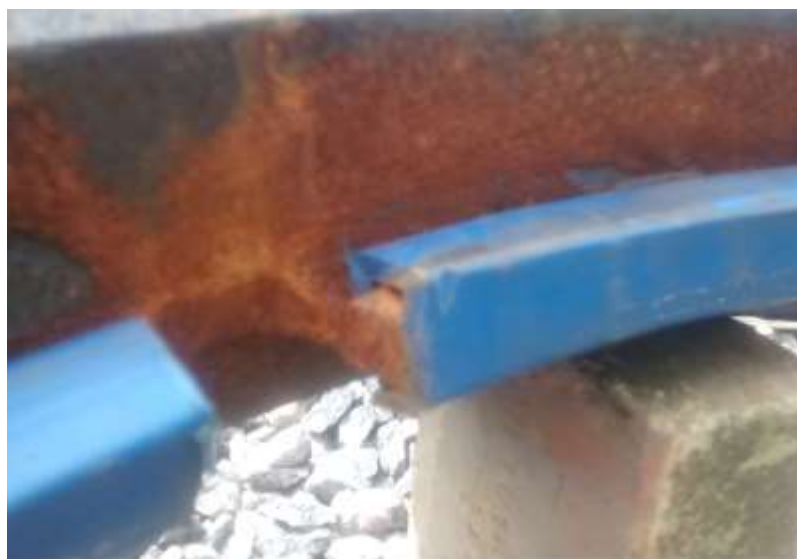
Figura 3 – Detalhe do anel antirruído fixado ao anel de ferro fundido