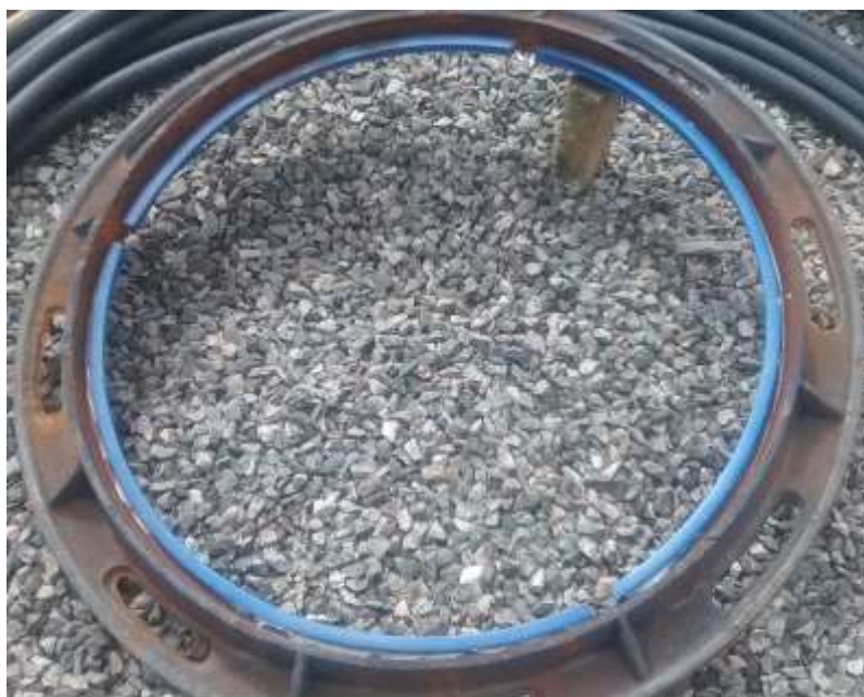
Figura 2 – Anel de ferro fundido e anel de polietileno